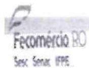
TABELA DE PREÇOS 2021